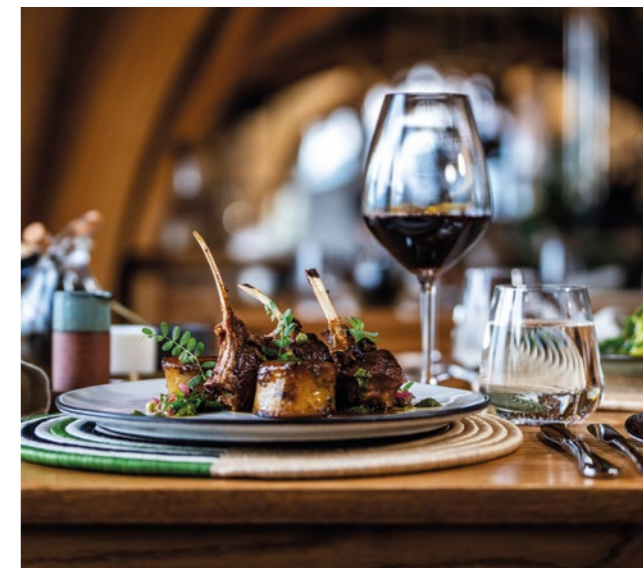
Acima, um dos três ambientes internos da premiada villa (212 metros quadrados) do Bisate Reserve; alta gastronomia servida no restaurante (abaixo) que prioriza ingredientes locais