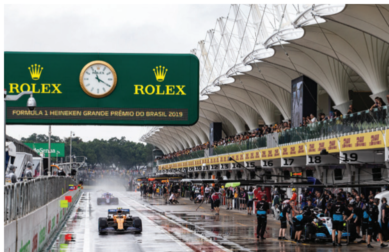
O treino da sexta (15 de novembro) começou com chuva e com a visita de Jackie Stewart ao paddock

Na sexta-feira, no primeiro dia de treinos do GP, quem causou alvoroço no paddock foi o lendário piloto britânico sir Jackie Stewart. Ele apareceu no lounge da Rolex, parceira global da Fórmula 1 e relógio oficial da categoria desde 2013. Uma fila se formou do lado de fora do lounge – e Jackie atendeu a todos, dando autógrafos e posando para selfies ( leia reportagem sobre os 100 anos da Rolex na pág. 98 ).